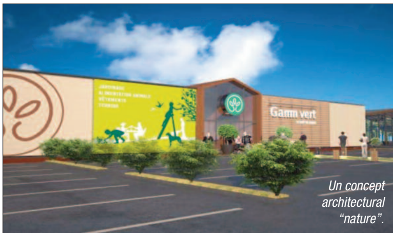
Un concept architectural "nature".